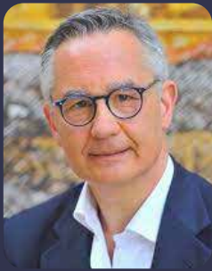
LUCIANO GAROFANO già Comandante del RIS Carabinieri di Parma, Presidente dell'Accademia Italiana di Scienze Forensi